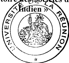
Pr. Michel WATIN

« Observatoire des Sociétés de l'Océan Indien »