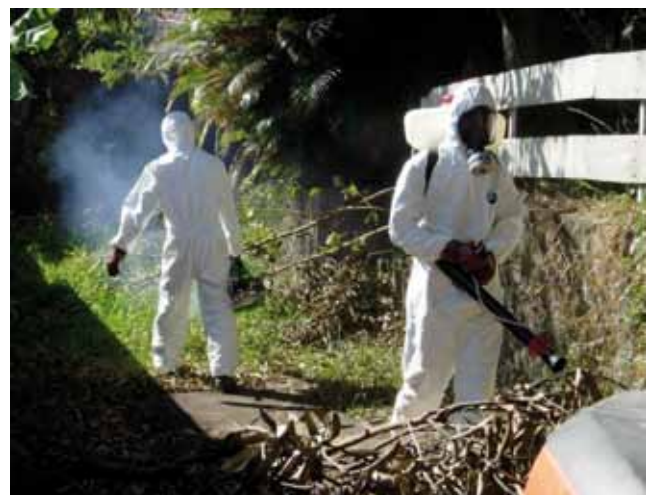
Figure 4. Lutte adulticide.

pour éviter ou limiter le risque de démarrage épidémique. Ainsi pour chaque signalement issu de la cellule de veille d'alerte et de gestion sanitaire (CVAGS) de l'ARS ou de la Cellule interrégionale d'épidémiologie (Cire), le service de LAV se charge de réaliser l'enquête épidémiologique chez le cas, assure son éducation sanitaire et celle de son quartier (prévention des piqûres, identification des symptômes, élimination des gîtes larvaires autour de la maison).