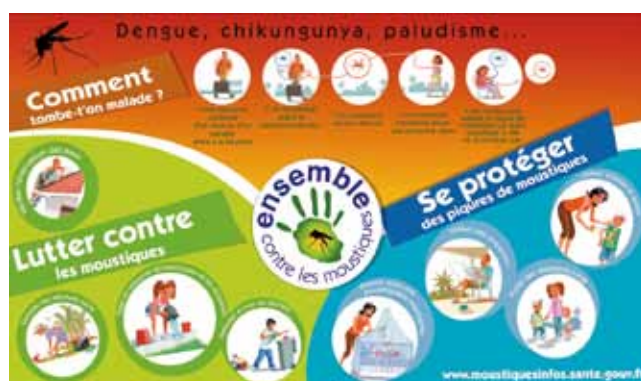
Figure 5. Messages de prévention contre les maladies vectorielles.

diffusés portent sur les modalités de prévention des gîtes larvaires autour de chez soi et sur les moyens de prévenir les maladies vectorielles à La Réunion ou en voyage (figure 5).