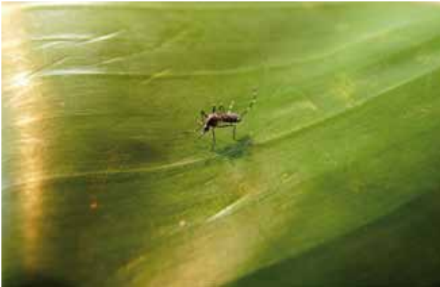
Figure 1 : Aedes albopictus .

préférentiellement en milieu urbain. Si la lutte contre le paludisme ne doit pas être abandonnée, cette réorganisation de la LAV vers la lutte contre les arboviroses devient impérative, l'épidémie majeure de chikungunya qui touche l'île en 2005-2006 (prévalence à 38 %) vient le confirmer. Cette épidémie, qui a permis de renforcer considérablement les moyens de lutte, peut être décrite en quatre phases avec une adaptation des mesures de LAV (périefocale autour d'un cas à systématique dans les quartiers urbains) en fonction de la situation épidémiologique :