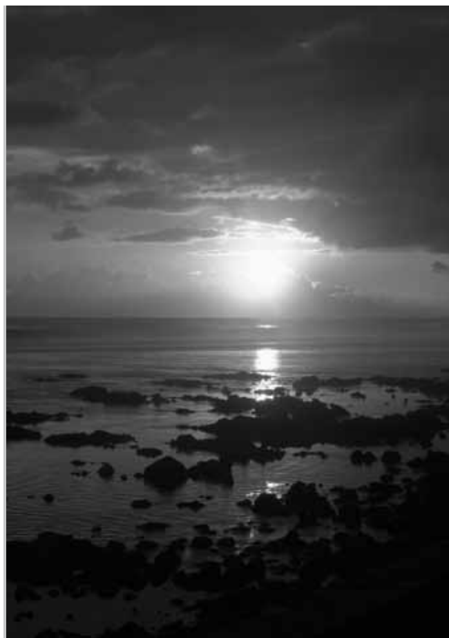
Coucher de Soleil sur la plage de St Leu © Emilie Javelle.