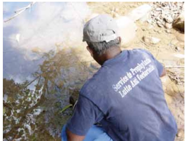
Figure 3. Surveillance anophélienne.

En effet, notamment pour des raisons de protection de l'environnement et de développement des résistances aux insecticides, la lutte adulticide est réservée aux zones à densité vectorielle très élevée et surtout à l'intervention autour des personnes malades (cas suspects ou confirmés). La priorité d'action du service reste l'intervention précoce autour des cas